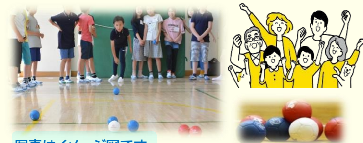
写真はイメージ図です