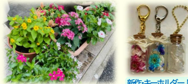
夏のぶらっと・プランター